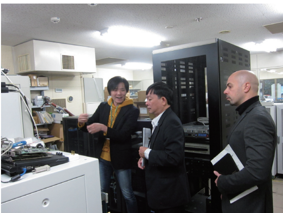
図4 サーバ室を案内

ネットワークラック前でも同様に、ネットワーク機器および、ファイアウォール機器の説明を、オープンキャンパスでの案内の英訳にて対応できました。原稿を読み上げるような形の案内は避けたく、内容をできるだけそらで言えるよう、繰り返し練習したつもりで、それは比較的達成できたように思いましたが、外国語とは言え、自分の言葉になっていたかどうかは、不十分な点があったのではと悔やまれます。