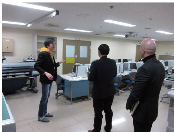
図2 自習室・演習室を案内

次に、情報科学センターの自習室・演習室を案内しました。自習室・演習室の他に、図書館、大学会館その他、合計200台以上の共用パソコンが存在し、情報科学センター提供アカウントを使うことでどこでも使えること、共用プリンタ、大判プリンタ、試験中の混雑具合等、説明しました。このあたりの内容は、年2回、留学生を対象に実施する、情報リテラシーガイダンスの内容をかいつまんで説明することで、比較的使い慣れた表現で案内することができたように思います。