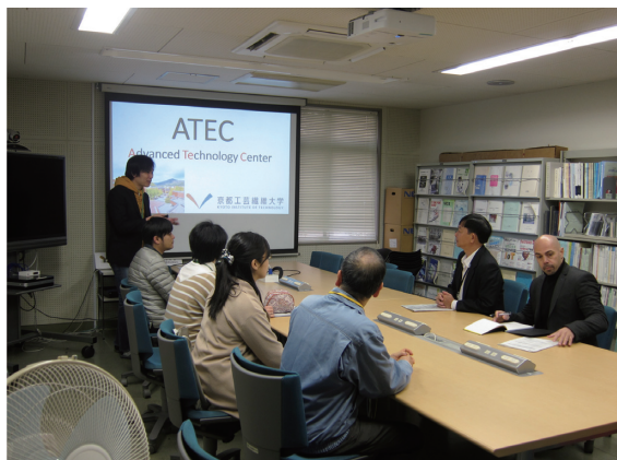
図1 会議室で全体案内および自己紹介

まずは、情報科学センターの会議室にて、お互いの簡単な自己紹介から始まり、本学の概要(教職員数等、規模)について説明を行いました。さらには情報科学センターを含め、さまざまな機関で研究支援を行っている、高度技術支援センターについて説明を行いました。